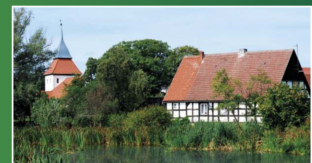
6. Na terenie zespołu przyrodniczo - krajobrazowo Kraina w Kratę w dolinie rzeki Moszczeniczki oprócz Muzeum Kultury Ludowej Pomorza w Swołowie podziwiać można wiele rzadkich i chronionych roślin, m.in. storczyki takie jak kukułka szerokolistna, kukułka Fuchsa i listeria jajowata.