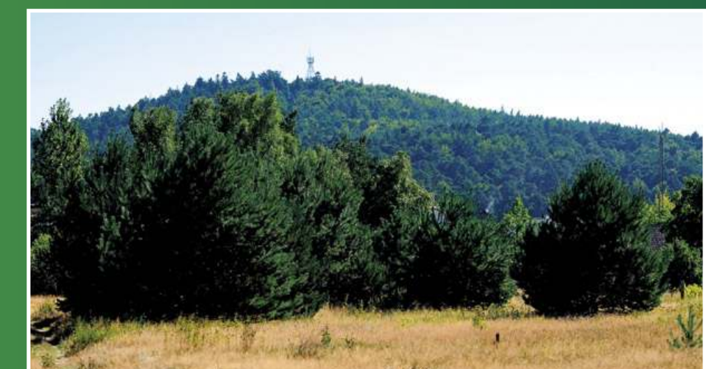
5. Wzgórze Rowokół , objęte ochroną jako rezerwat przyrody, zwane jest również Świętą Górą. W czasach pogańskich stanowiło ono miejsce kultu Pomorzan. Na szczycie wzgórza o wysokości 115 m n.p.m. z wieży widokowej podziwiać można panoramę okolicy.