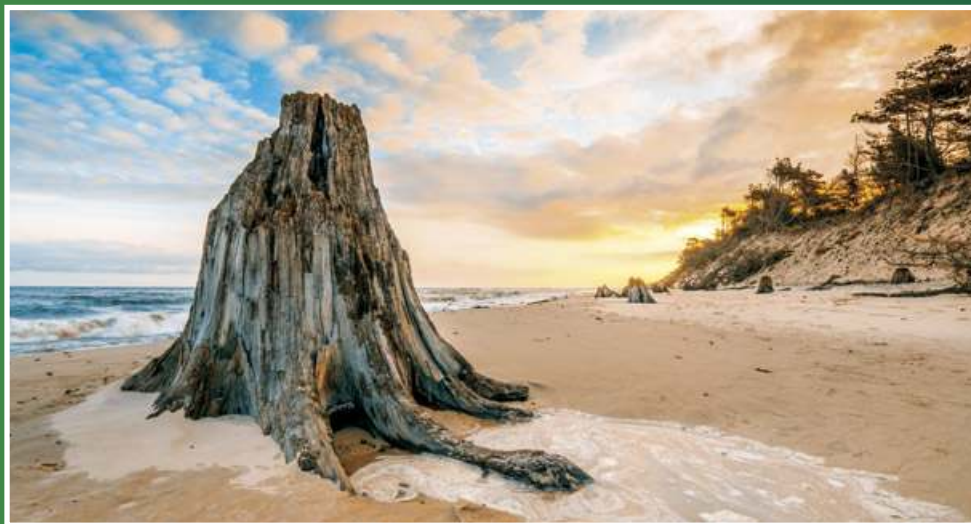
1. Słowiński Park Narodowy jest największym w Europie skupiskiem „wędrujących wydm”, poruszających się z maksymalną prędkością do 10 m/rok. Swoistą osobliwość SPN stanowi „martwy las” - pozostałość po rosnącej tam 3 tys. lat temu dębowej puszczy.