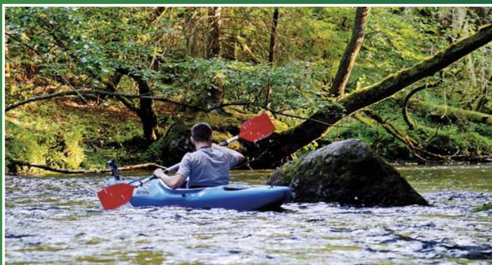
3. Obszar Natura 2000 Dolina Wieprzy i Studnicy , ze względu na podgórski charakter rzeki oraz malowniczą okolicę stanowi nie lada gratkę dla miłośników kajakarstwa. Na jego terenie podziwiać możemy wiele roślin rzadkich i zagrożonych z Czerwonej Księgi, w tym największe na Pomorzu skupisko krasnorostu.