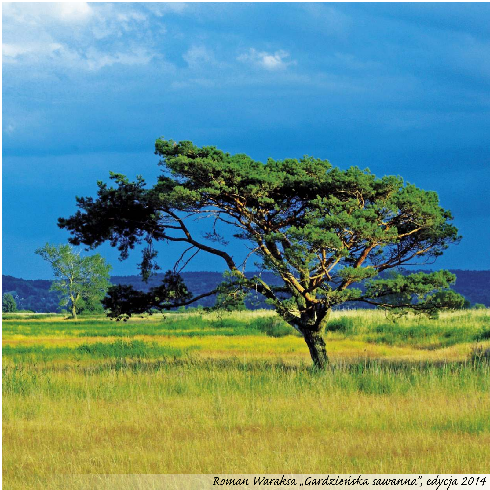
Roman Waraksa „Gardzieńska sawanna”, edycja 2014