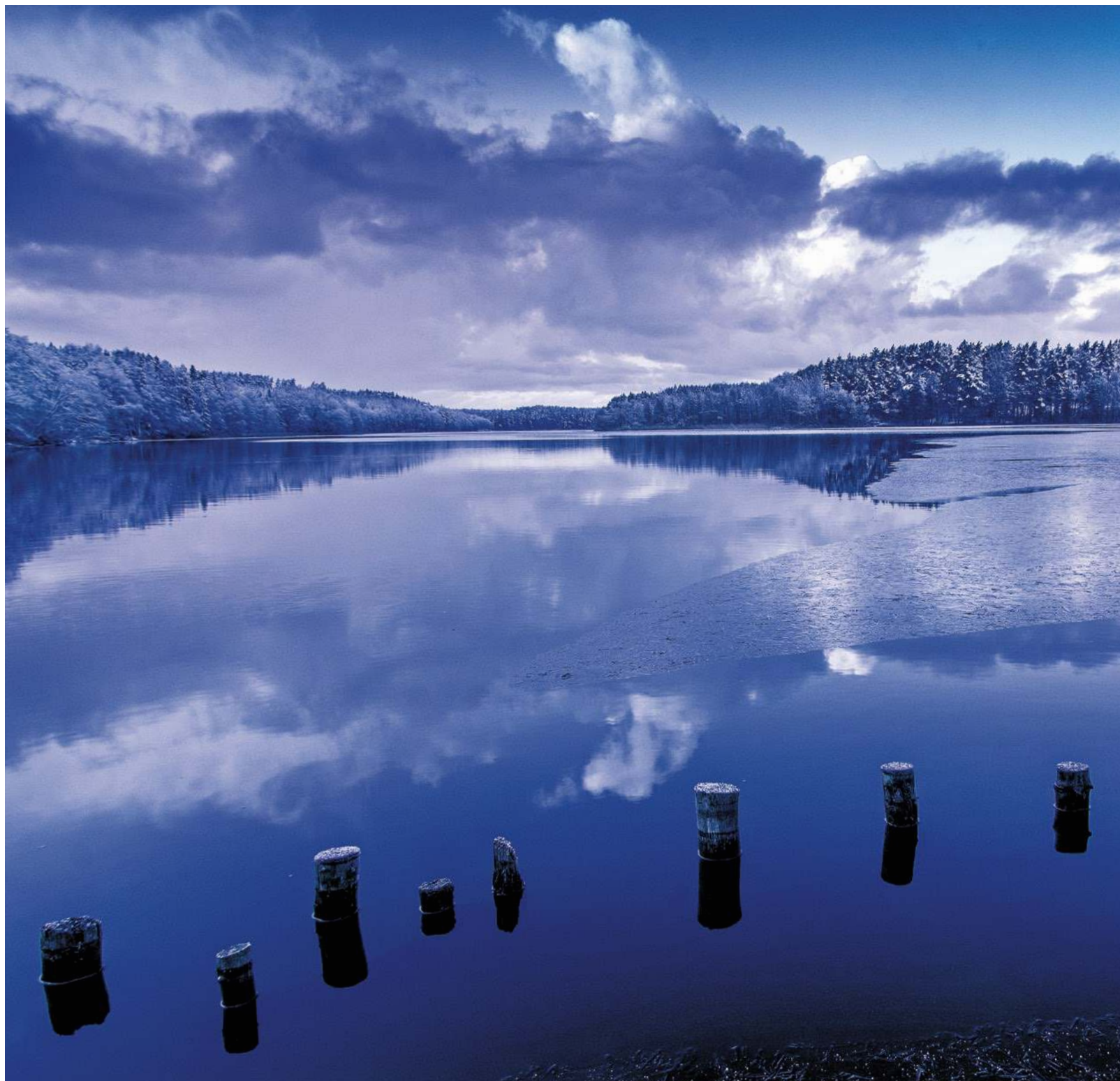
Witold Leśniewski „Papieski szlak kajakowy zimą”, edycja 2016