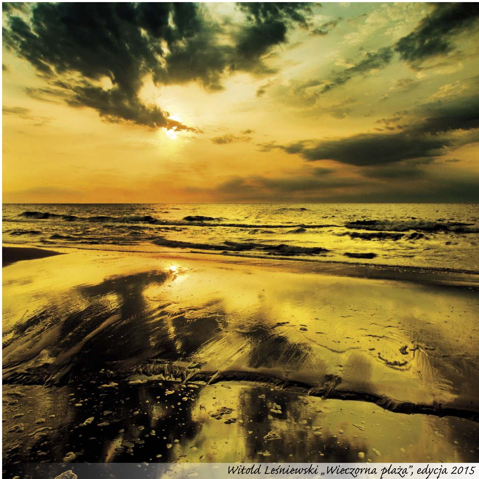
Witold Leśniewski „Wieczorna plaża”, edycja 2015