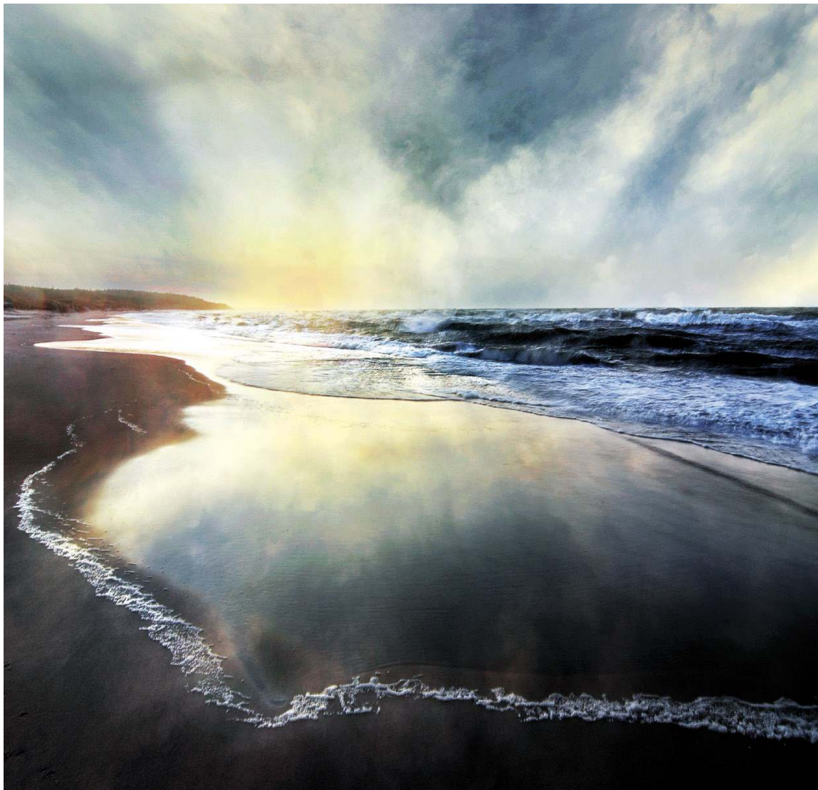
Witold Leśniewski „Sztormowy poranek”, edycja 2016