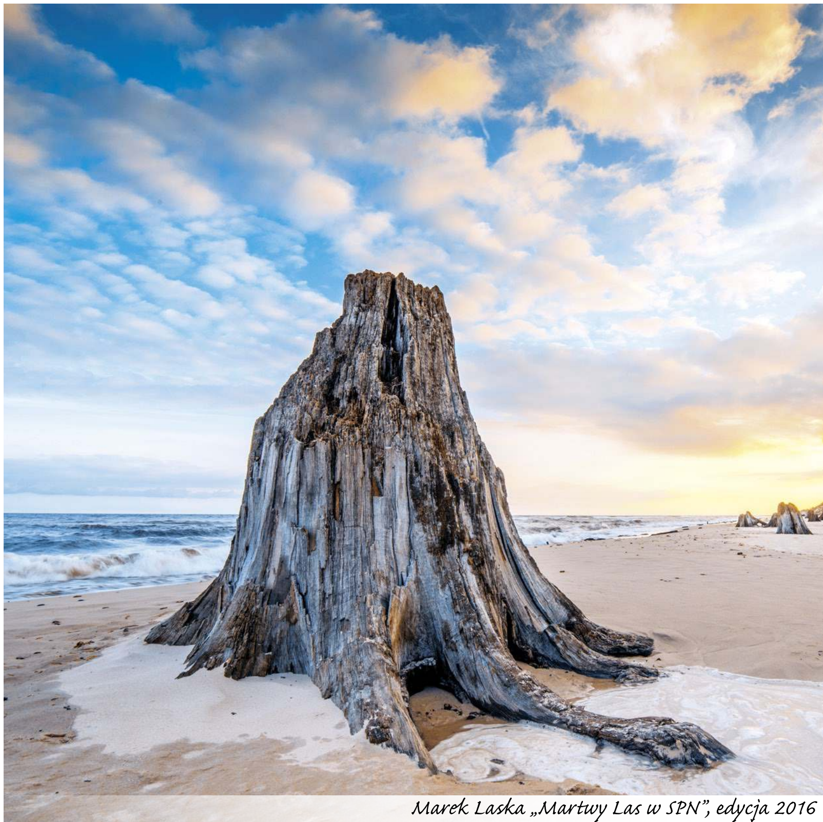
Marek Łaska „Martwy Las w SPN”, edycja 2016