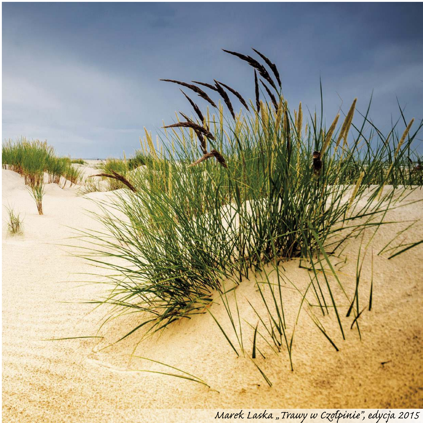
Marek Laska „Trawy w Czotpinie”, edycja 2015