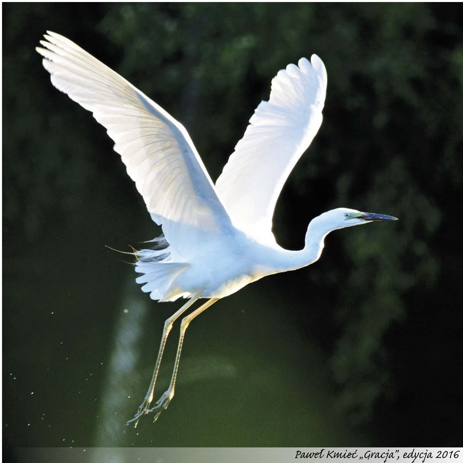
Paweł Kmiec „Gracja”, edycja 2016