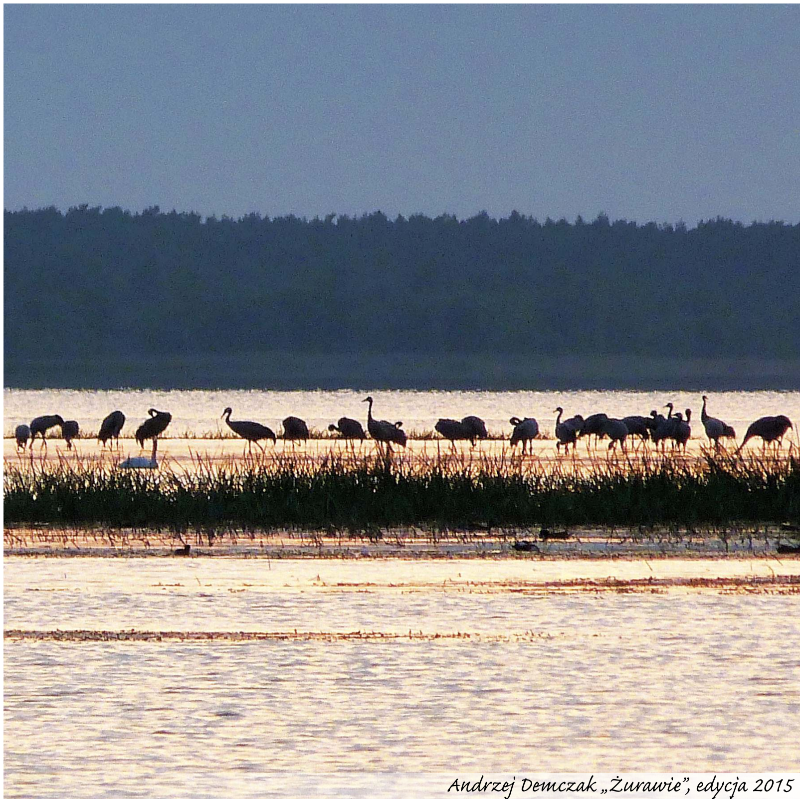
Andrzej Demczak „Żurawie”, edycja 2015