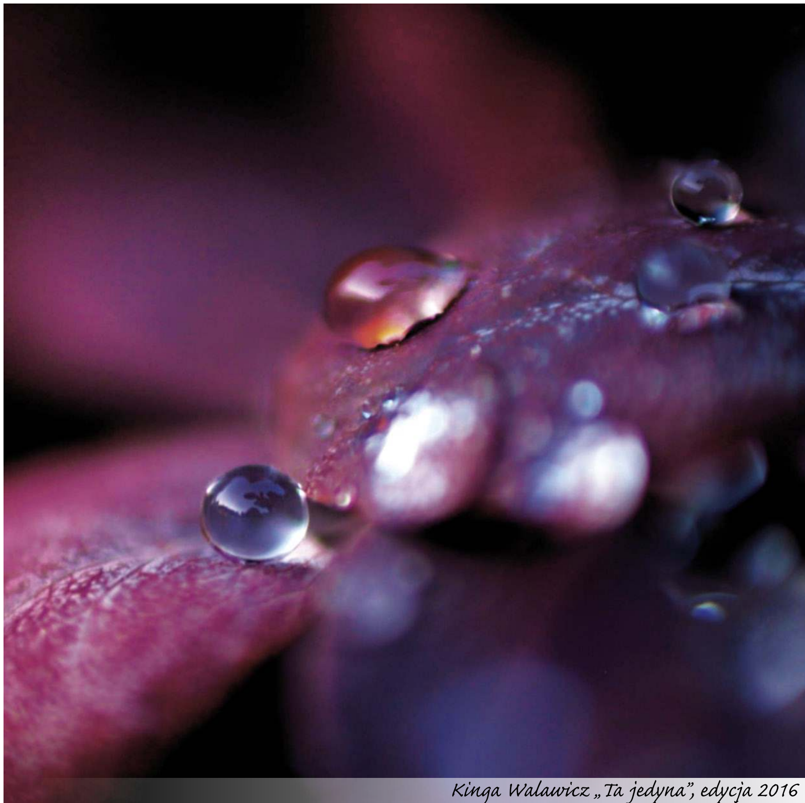
Kinga Walawicz „Ta jedyna”, edycja 2016