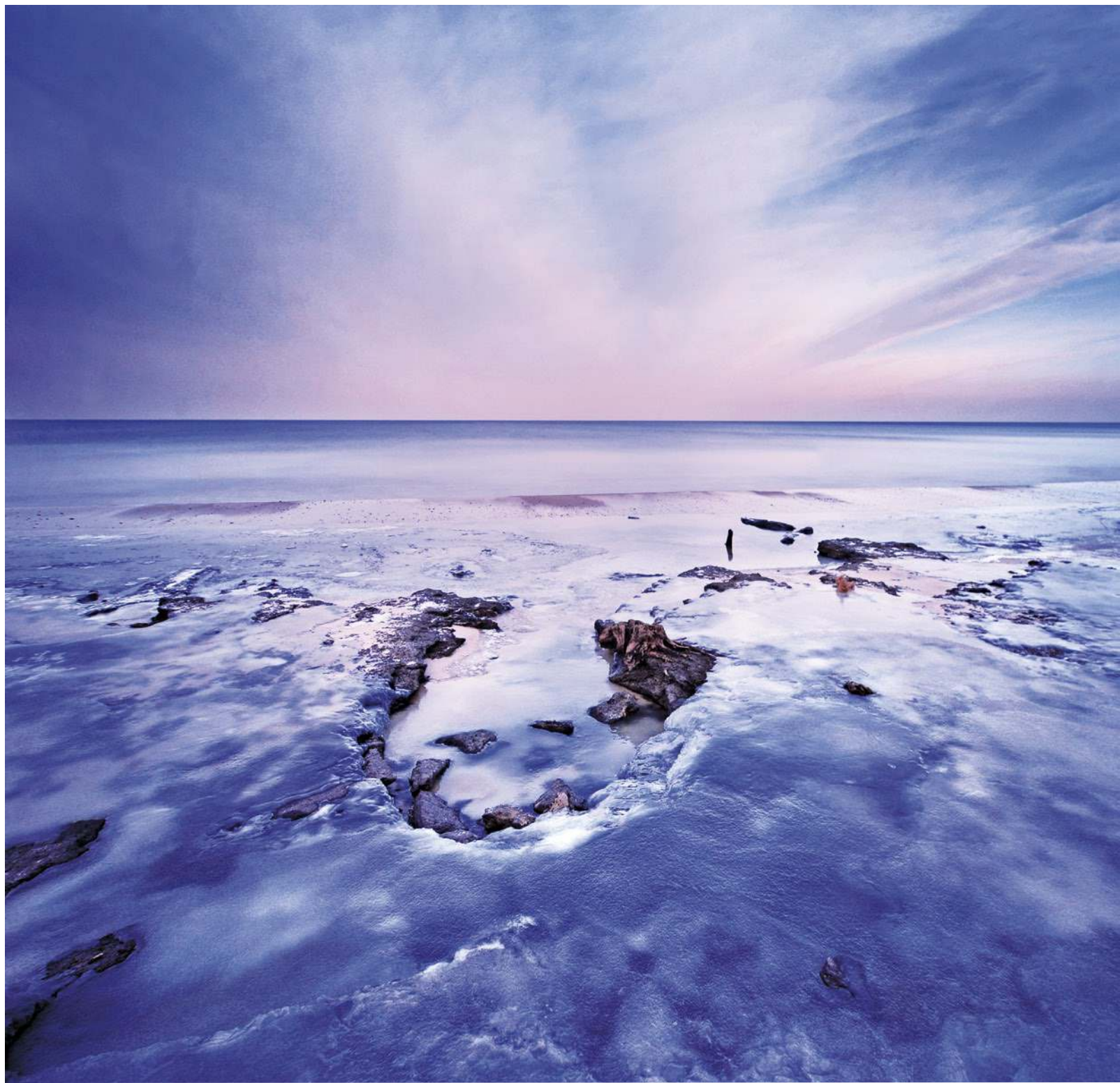
Witold Leśniewski „Zimowy brzask”, edycja 2016